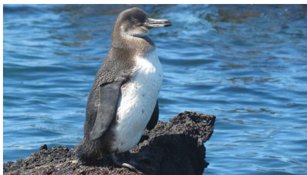
Pinguim de Galápagos