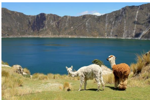
Lago Quilotoa com lhamas

Desistências – serão descontadas taxas de desistências e de serviços.